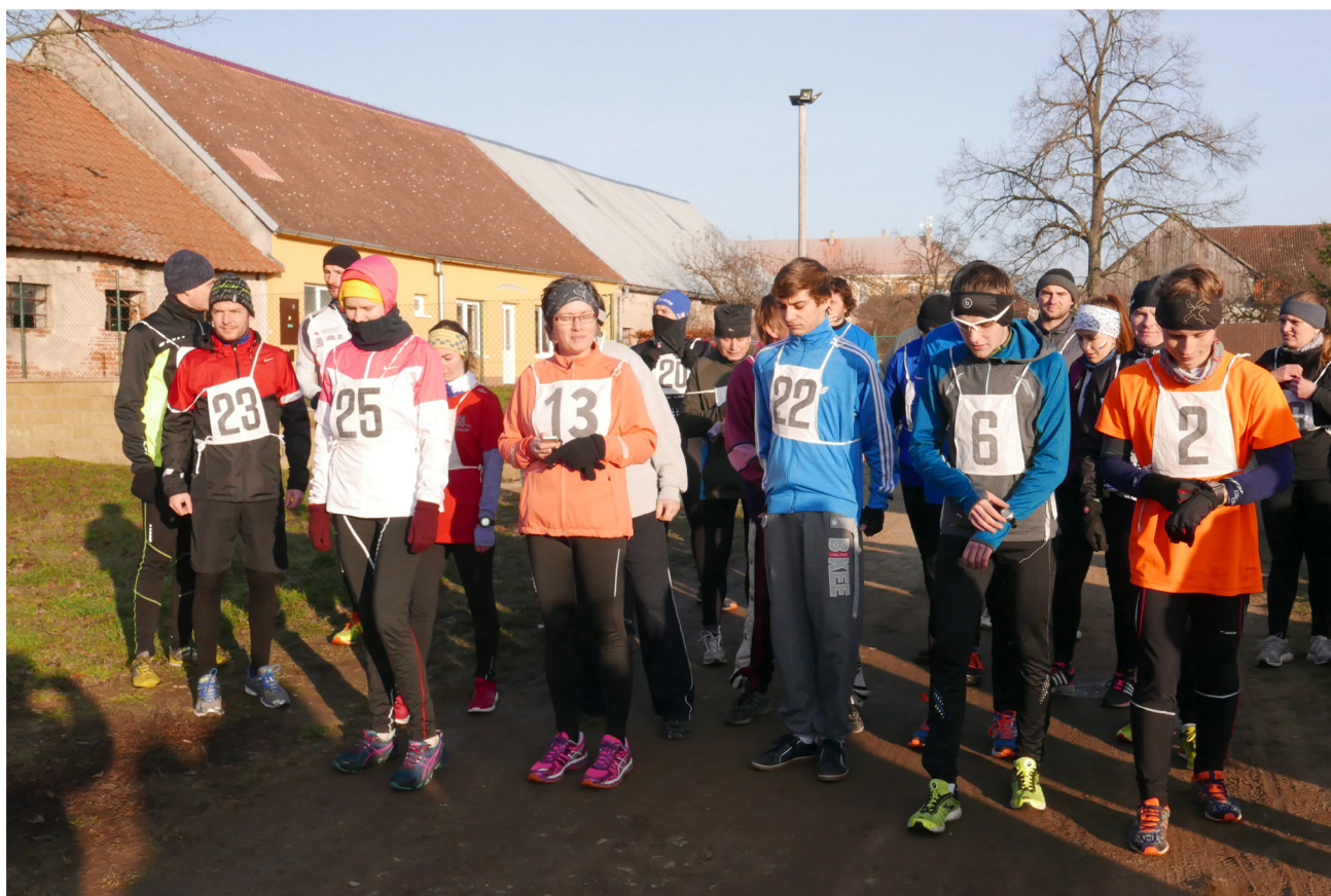
Běh o vánočního kapříka