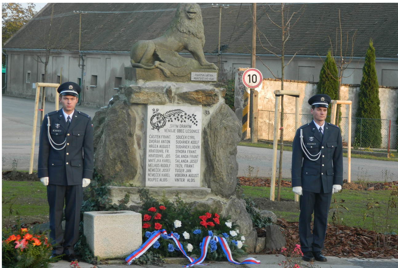
Kladení věnců k výročí založení Československa