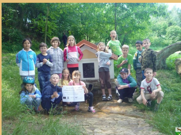
Studánka u Verunky

V pondělí 23. června jsme se vypravili na další „cyklovýlet“ tohoto školního roku. Tentokrát jely děti 3. až 5. ročníku, jeli jsme se podívat k Čertově studánce, která se nachází kousek za Lesonicemi, konkrétně za hájenkou na Žlabech. Provedli jsme stejná měření jako u babické studánky, tedy pH a teplotu vody. Pouze průtok vody jsme neměřili. Ve škole ještě 4. a 5. ročník vymýšlel pověst, která by se mohla vázat k Čertově studánce. Výsledkem byla spíše pohádka – ale opravdu vydařená :-).