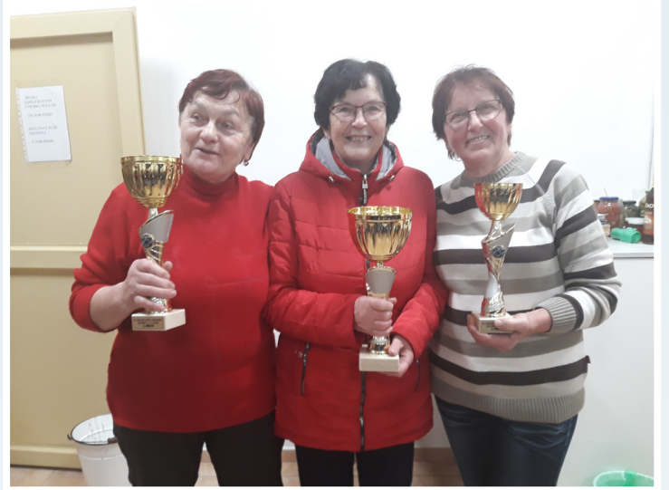
Košť slivovice – vítězové