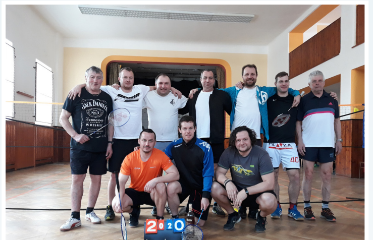
Turnaj v badmintonu