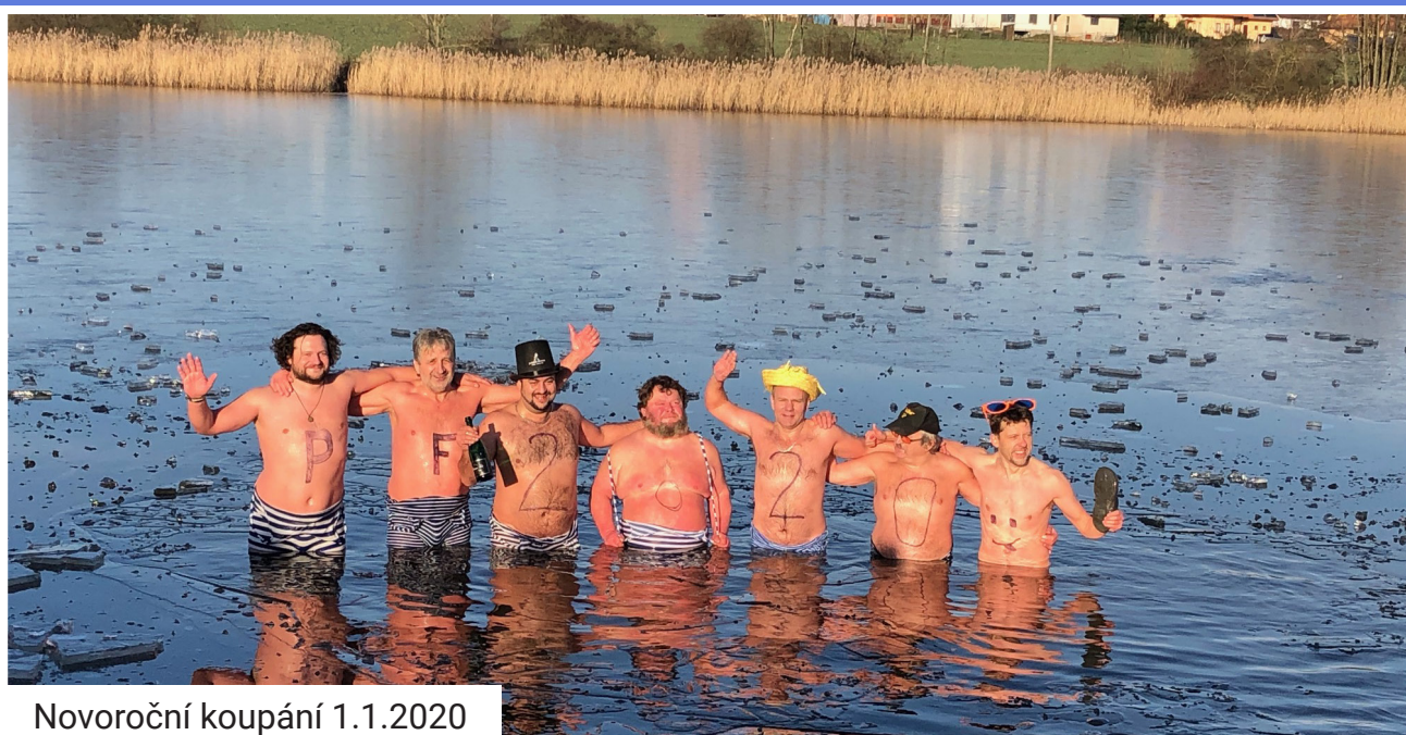
Novoroční koupání 1.1.2020