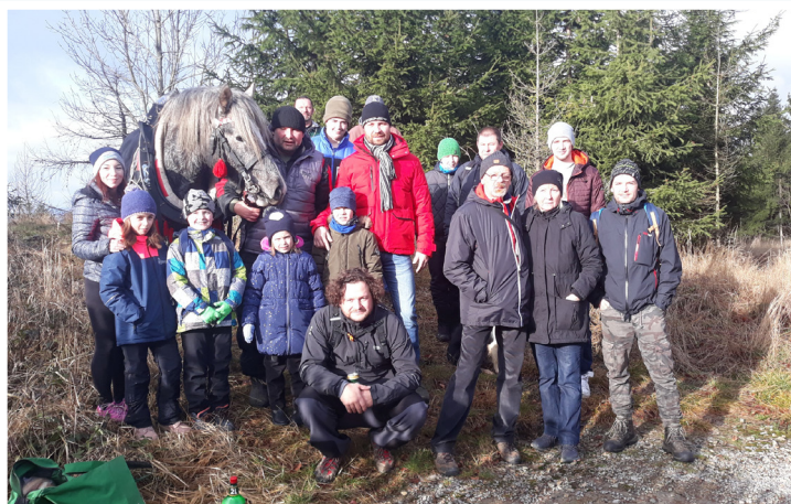
Výšlap k vysílači