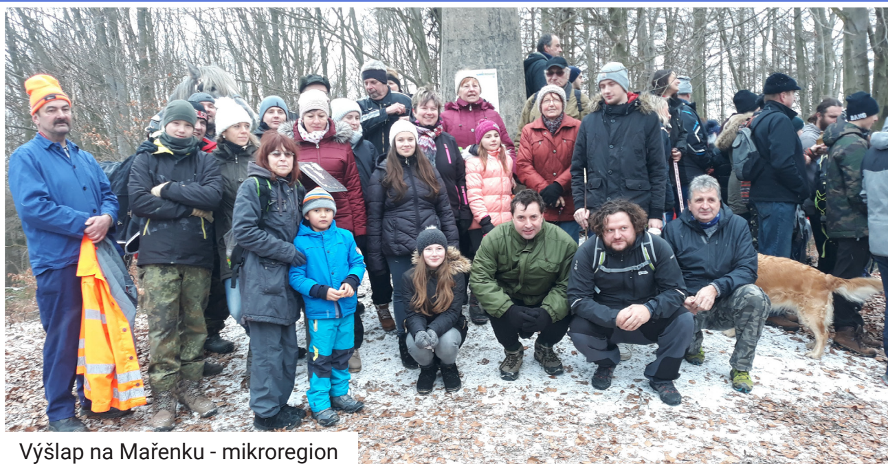
Výšlap na Mařenku - mikroregion