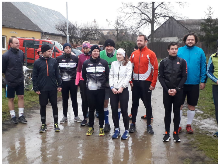
Běh o vánočního kapříka