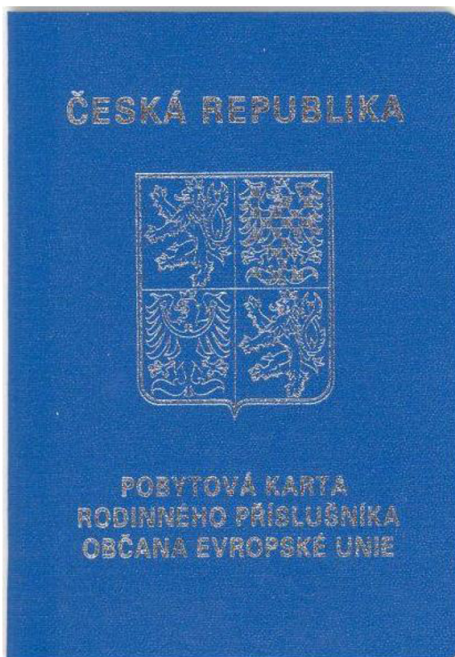
Přední strana dokladu (tmavě modrý doklad ve formě knížky, stříbrný tisk na přední straně)