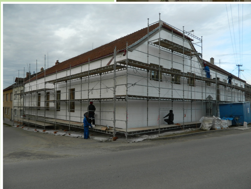
Zateplení budovy Sokolovny