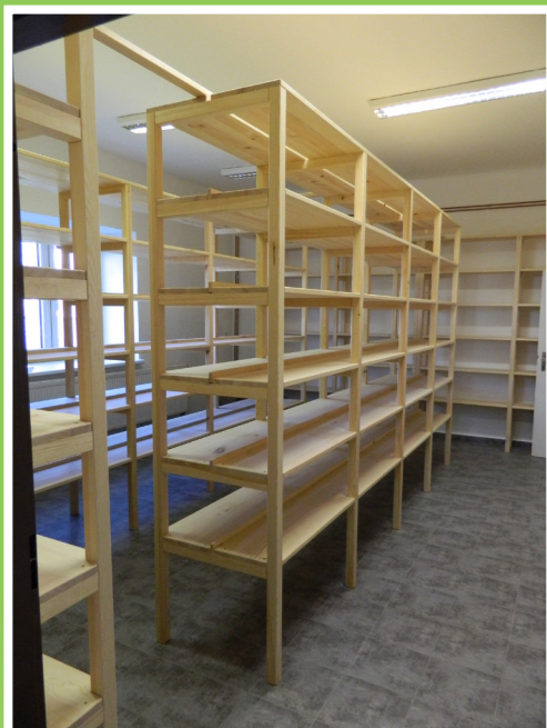
Nová spisovna obecního úřadu