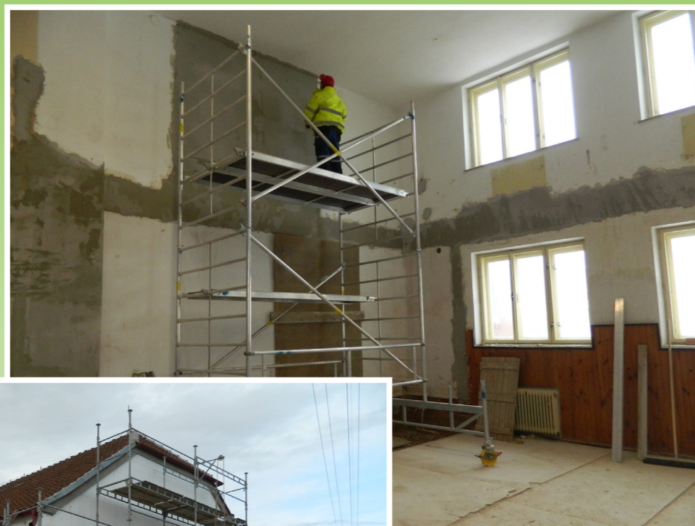
Opravy sálu v Sokolovně