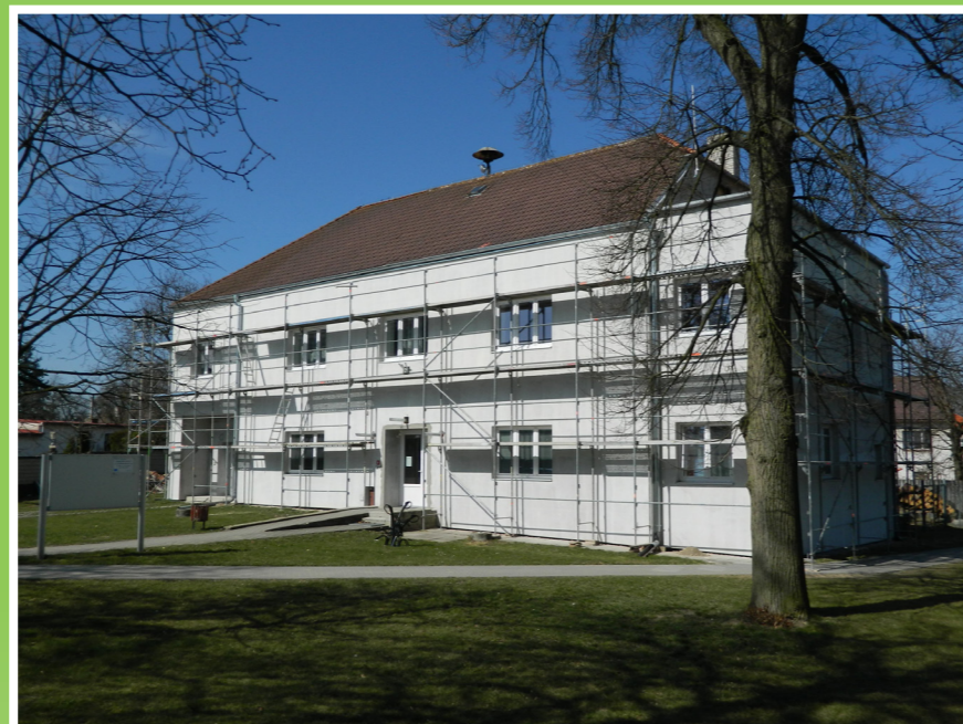
Zateplení budovy obecního úřadu